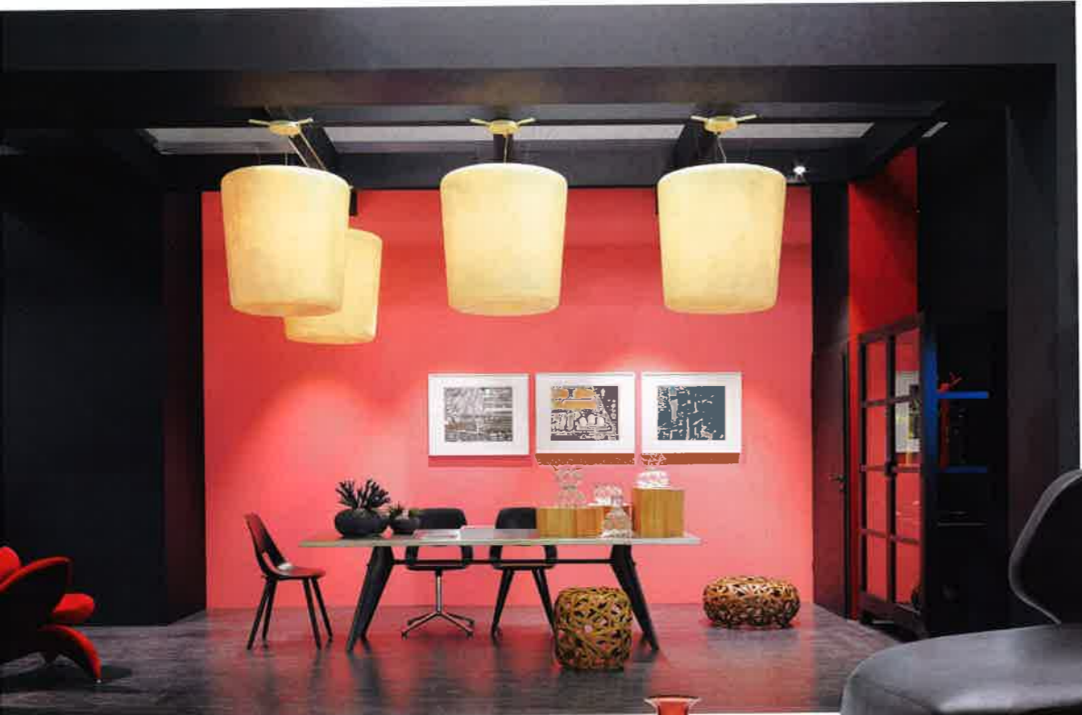
Einer japanischen Lackschatulle gleich rahmen Boden, Decke und Wände mit ihren sublimen Rot- und Schwarztönen ausgesuchte Objekte von der handgearbeiteten italienischen Lampe bis zur Schweizer Stuhl-Ikone und dienen dabei sowohl als Bühne wie als ästhetische Klammer.

Einnehmend schlicht, aber flamboyant war die AD Lounge auf Frankfurts legendärer Messe rund um Dining, Giving und Living, bei der Japan erstes außereuropäisches Partnerland war. Gestaltet hat sie der Münchener Interiordesigner Jan Reuter, der seinen exquisiten Mix mit Kunst und Design aus dem Land der aufgehenden Sonne abrundete