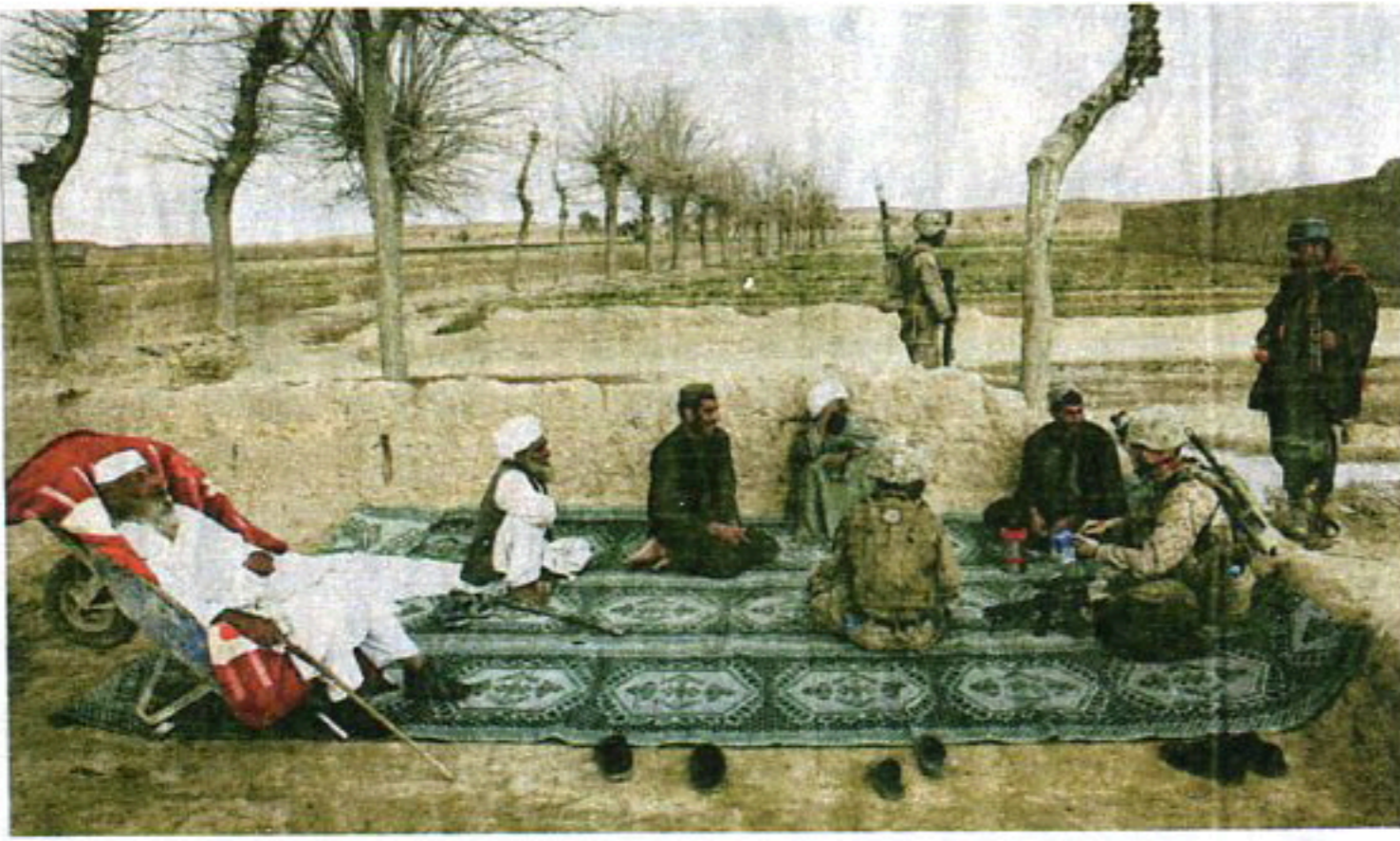
Vorlage Foto aus der SZ vom 2.12.2011